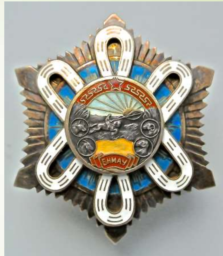
Монгольский Орден «Полярная Звезда»