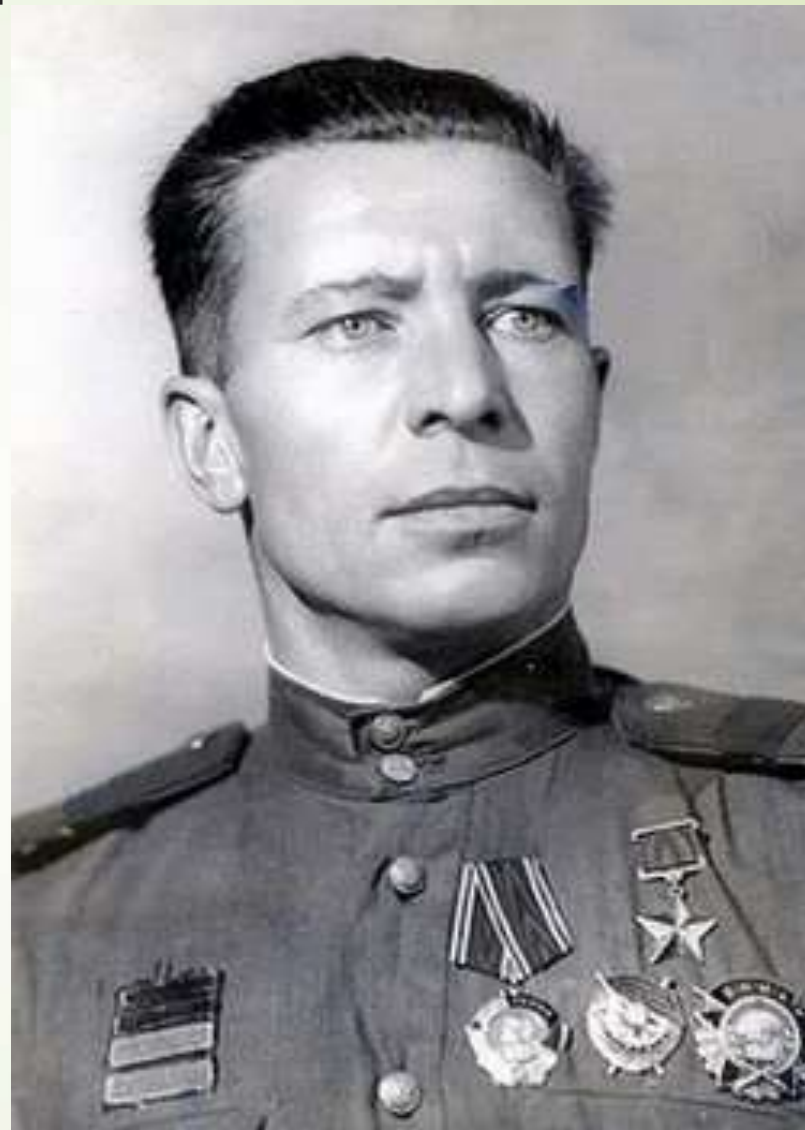
Получил звание Героя Советского Союза (3.06.1944)