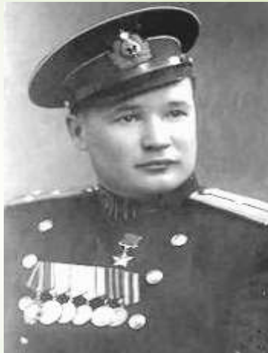
Получил звание Героя Советского Союза (1943).